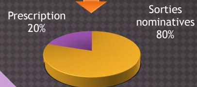
Figure 3 : Sources d'erreur

→ 47 erreurs de saisies, soit 87 % d'erreur